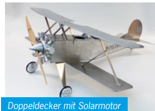
Doppeldecker mit Solarmotor