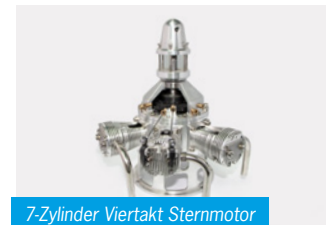
7-Zylinder Viertakt Sternmotor