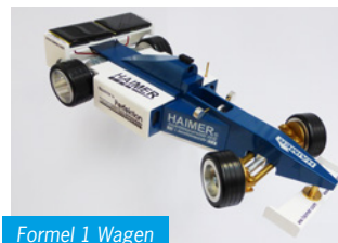
Formel 1 Wagen